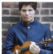
AUGUSTIN HADELICH violino 20 giugno Masterclass straordinaria