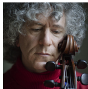
STEVEN ISSERLIS violoncello 22 giugno Masterclass straordinaria