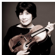
NOBUKO IMAI viola 23 giugno Masterclass straordinaria